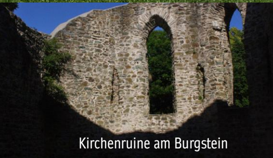
Kirchenruine am Burgstein