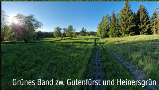
Grünes Band zw. Gutenfürst und Heinersgrün