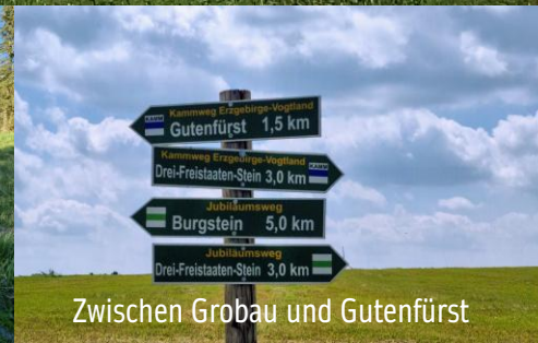
Zwischen Grobau und Gutenfürst